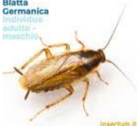
Blatta Germanica individui adulti - maschio